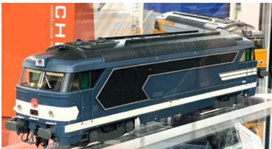
BB67092 proto de Chrezo

Le zéro à Meursault : www.cercleduzero.org/forum/viewtopic.php?p=124539