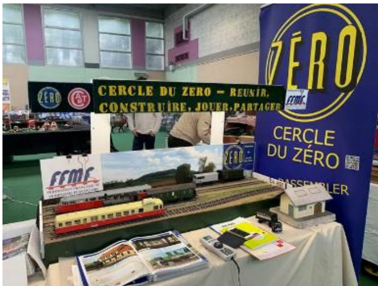
Le Cercle à Pierre-Bénite (69), 6 décembre 2025

Vous voulez contribuer au partage du zéro comme l'indique la devise CDZ ?