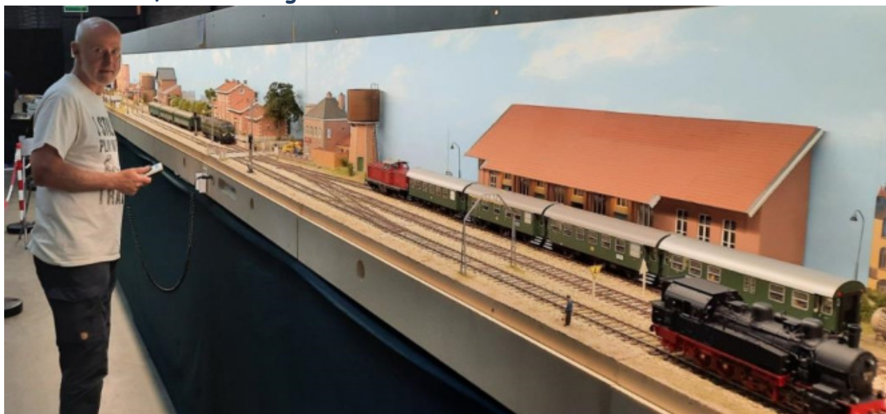
LA GARE DES YRÉES du RMCCO (62) en Oe