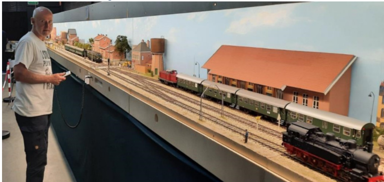
La gare des Yrées du RMCCO (62) en Oe