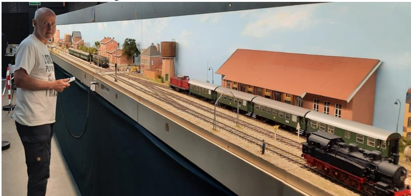
La gare des Yrées du RMCCO (62) en Oe