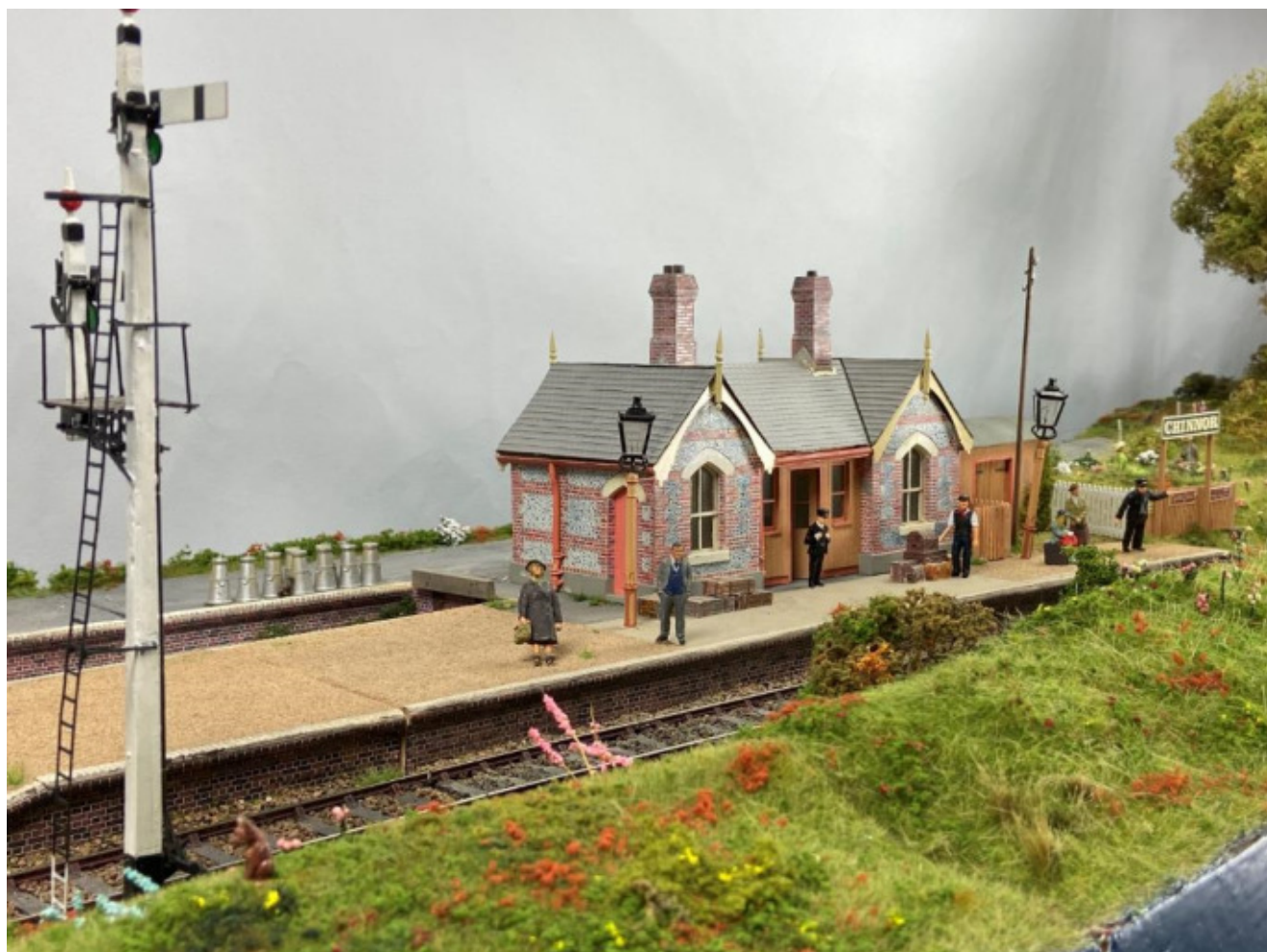
Modules zéro de la CATM de Bruno Delahaye