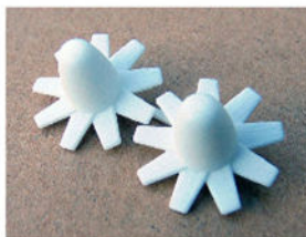
Les ventilateurs en impression 3D

Allez voir la vidéo d'un modèle avec les ventilateurs fonctionnels sur le site de :