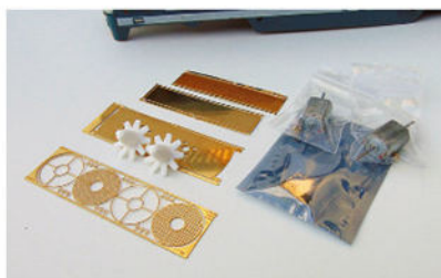
Les pièces comprises dans le set