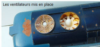
Les ventilateurs mis en place