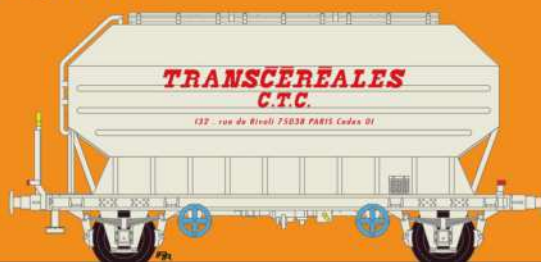
Réf 433022 - Wagon céréaliers à 2 essieux freinés déco Transcéréales CTC - SNCF Ep IV - UIC - 5 numéros possibles