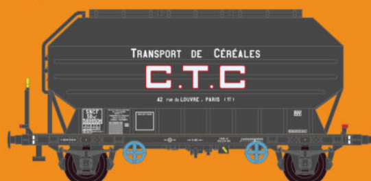
Réf 433012 - Wagon céréaliers à 2 essieux freinés déco CTC gris foncé - SNCF Ep III - 5 numéros possibles