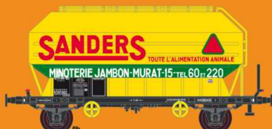
Réf 433023 - Wagon céréaliers à 2 essieux non freinés déco Sanders- SNCF Ep IV - UIC