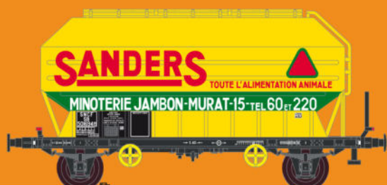
Réf 433013 - Wagon céréaliers à 2 essieux non freinés déco Sanders 1er modèle - SNCF Ep III