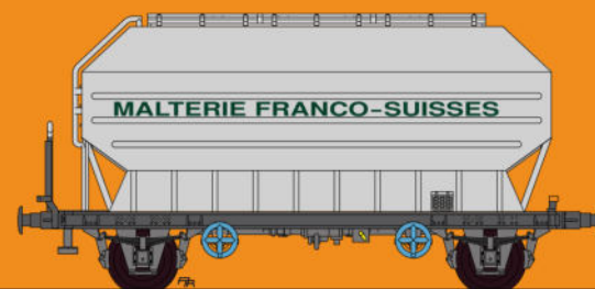
Réf 433018 - Wagon céréaliers à 2 essieux freinés déco Malterie Franco-Suisses - SNCF Ep III