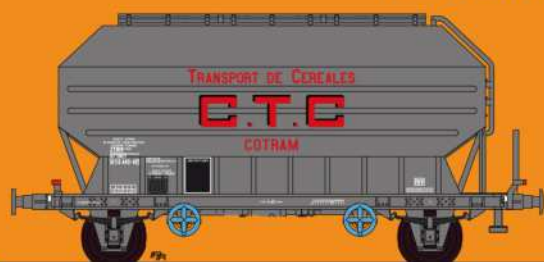
Réf 433021 - Wagon céréaliers à 2 essieux non freinés déco CTC gris moyen - SNCF Ep IV - UIC - 5 numéros possibles

Vous trouverez les versions Ep III au dos