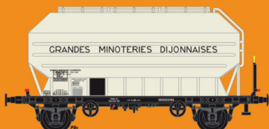
Réf 433015 - Wagon céréaliers à 2 essieux freinés déco Grande Minoterie Dijonnaise - SNCF Ep III