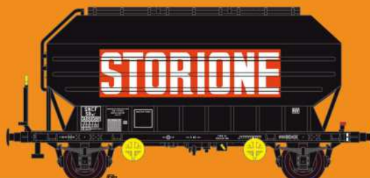
Réf 433024 - Wagon céréaliers à 2 essieux freinés déco Storionne SNCF Ep IV - UIC - 5 numéros possibles