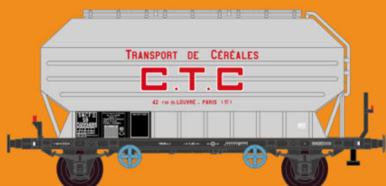
Réf 433011 - Wagon céréaliers à 2 essieux non freinés déco CTC gris clair - SNCF Ep III - 5 numéros possibles

Vous trouverez les versions Ep IV au dos