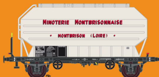
Réf 433016 - Wagon céréaliers à 2 essieux freinés déco Minoterie Monbrisonnaise - SNCF Ep III