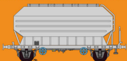
Réf 433020 - Wagon céréaliers à 2 essieux freinés peint en gris sans déco pour réaliser la vôtre

Rail 43 est produit par APR Prod s.a.r.l. 35 rue vieille de Chars - F - 95640 Marines - France Email : rail43@orange.fr - Web site : https://rail430.wixsite.com/rail43 Siret : 900 564 832 00019