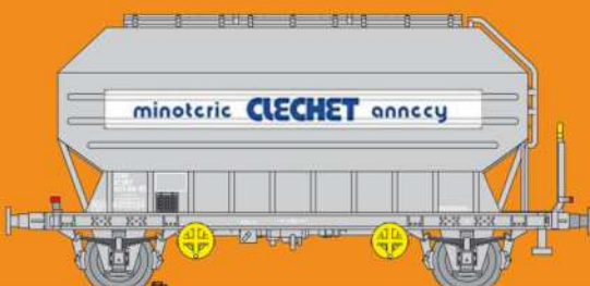
Réf 433026 - Wagon céréaliers à 2 essieux freinés déco Moulins Clechet Ep IV - UIC