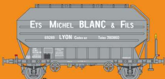
Réf 433025 - Wagon céréaliers à 2 essieux freinés déco Michel Blanc SNCF Ep IV - UIC