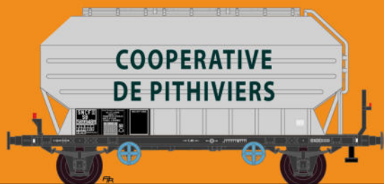
Réf 433017 - Wagon céréaliers à 2 essieux non freinés déco Coopérative de Pithiviers - SNCF Ep III