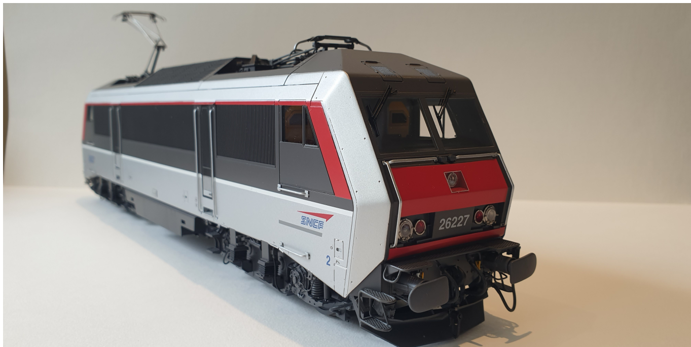
BB 26227 livrée Multiservice