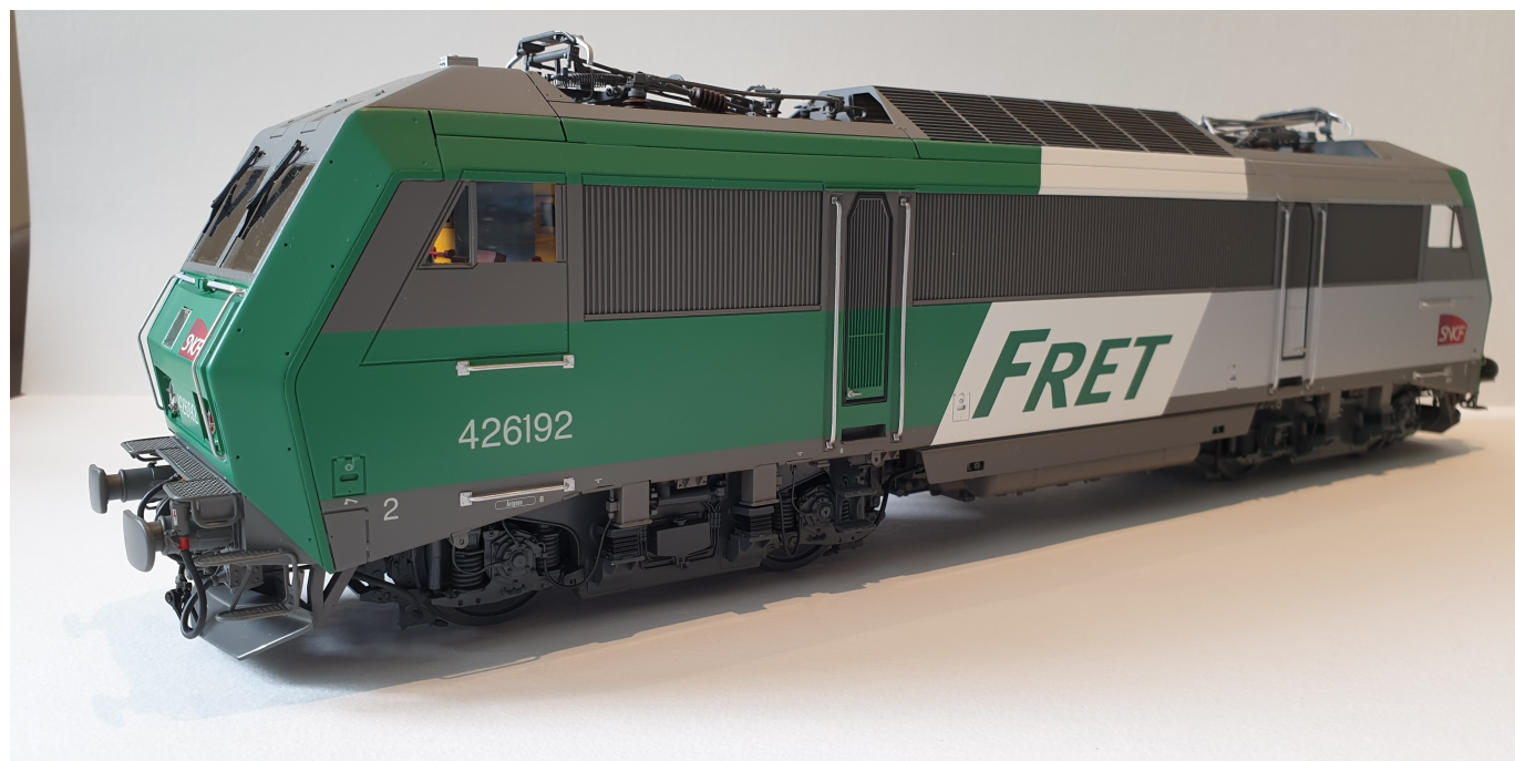
BB 26192 livrée Fret