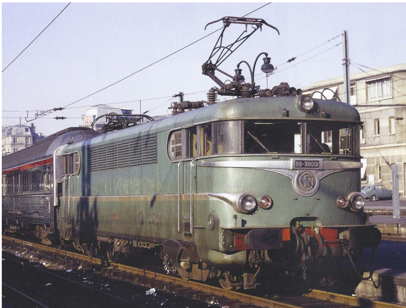
BB 30001 en tête d'un TEE sur la région Nord

Pour les BB 9400, certaines décorations ont été abandonnées pour la même raison que précédemment (versions béton), tandis que la version bi-courant BB 30000 (courant alternatif 25 kV et courant continu 1,5/ 3 kV) a été maintenue car ayant été commandée en nombre suffisant. Seul, le numéro de cette micro série a été modifié, passant de 30002 à 30001, cette dernière locomotive ayant eu une période de vie un peu plus longue que celle de sa consœur.