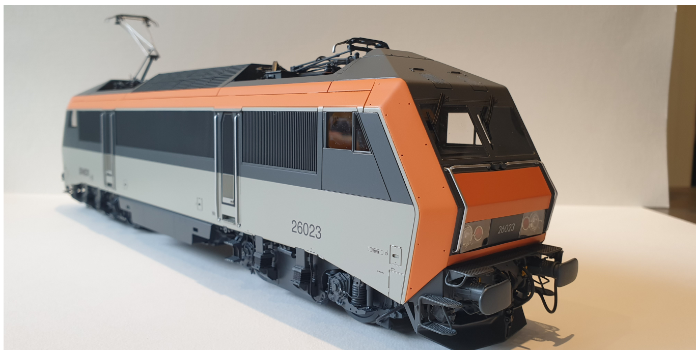
BB 26023 livrée d'origine