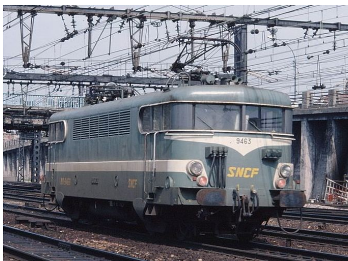
BB 9463 (livrée Béziers)