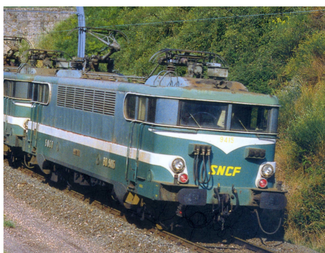
BB 9415 (livrée Béziers)