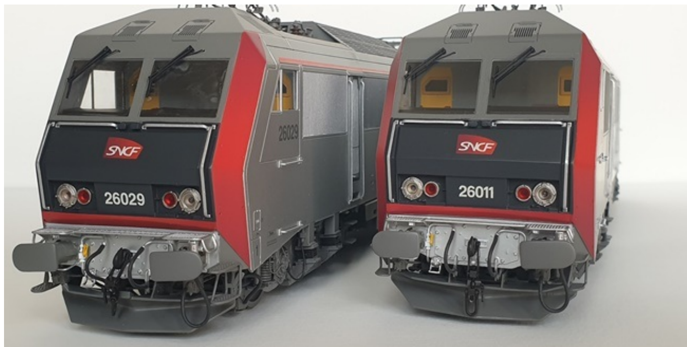
BB 26029 & 26011 livrée Carmillon