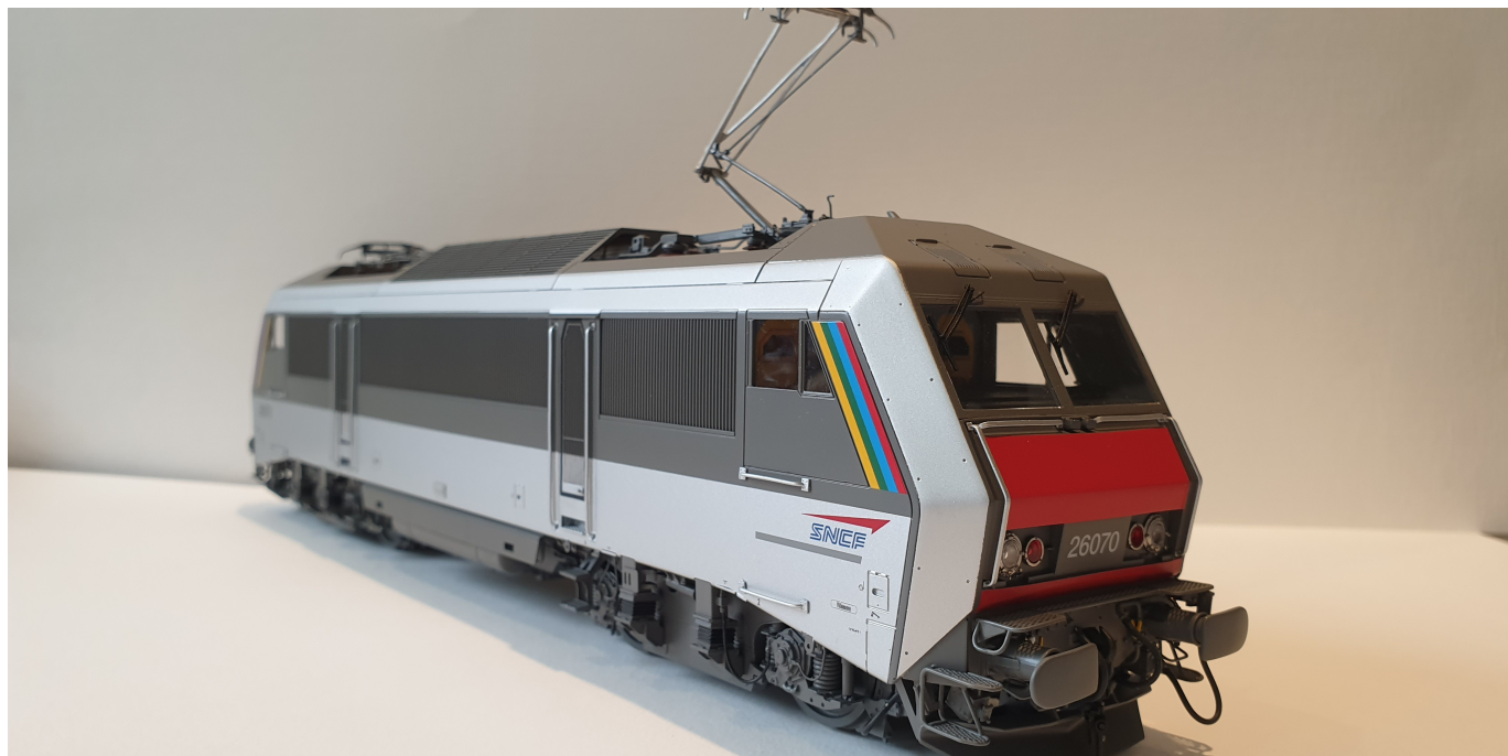
BB 26070 livrée TER Alsace