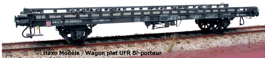
Haxo Modèle - Wagon plat UFR Bi-porteur