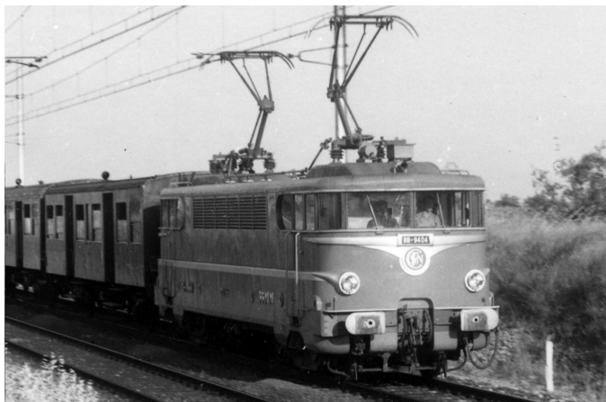
V1.1 - Version d'origine toit bas sans cablot d'UM

Le fabricant a commencé l'étude économique de la réalisation des modèles. Je vous communique ci-après le détail provisoire des versions retenues (BB 9400 seulement) :