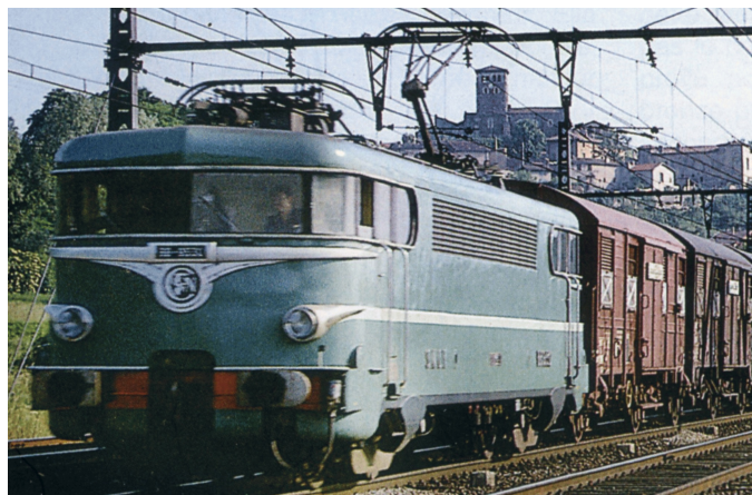
V1.2 - Version d'origine toit haut sans cablot d'UM