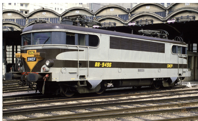
V5.2 - Version Arzens toit haut avec cablots d'UM

Ces modèles seront proposés, tout comme les 26000, en version analogique (vitrine) ou digitale sonore avec pantographes motorisés. En fonction de la demande, il sera possible d'y ajouter des versions modernisées - BB 9600 - en décoration gris bleu TGV Atlantique (deux machines effectuant la navette TOURS - ST PIERRE DES CORPS) ou en décoration gris béton, ainsi que la version bi-courant BB 30001/2 pour la traction des TEE sur PARIS - BRUXELLES antérieurement aux CC 40100.