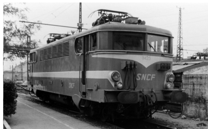
V3.1 - Version Béziers toit bas avec cablots d'UM