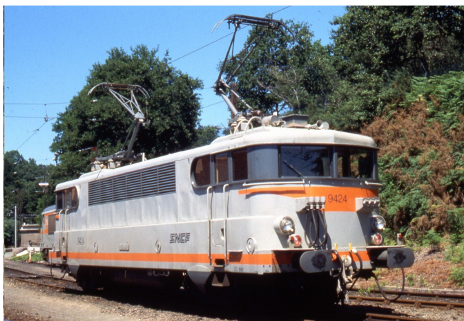
V4.1 - Version Béton toit bas avec cablots d'UM