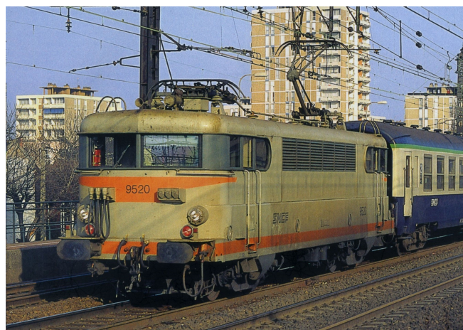
V4.2 - Version Béton toit haut avec cablots d'UM