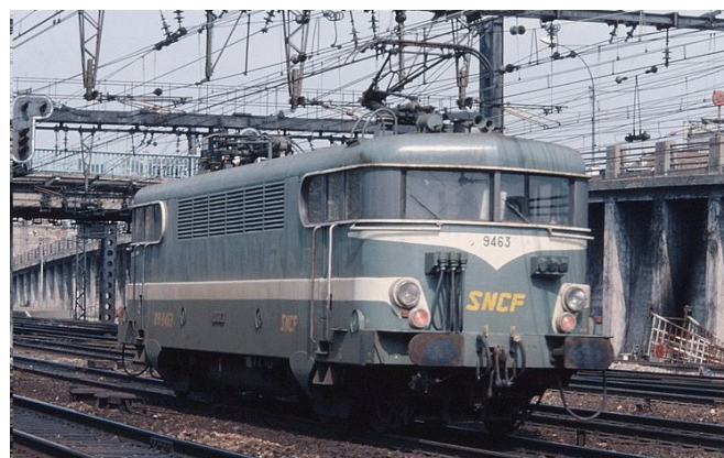
V3.2 - Version Béziers toit haut avec cablots d'UM