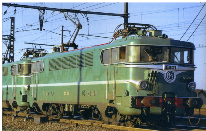
V2.1 - Version d'origine toit bas avec cablots D'UM