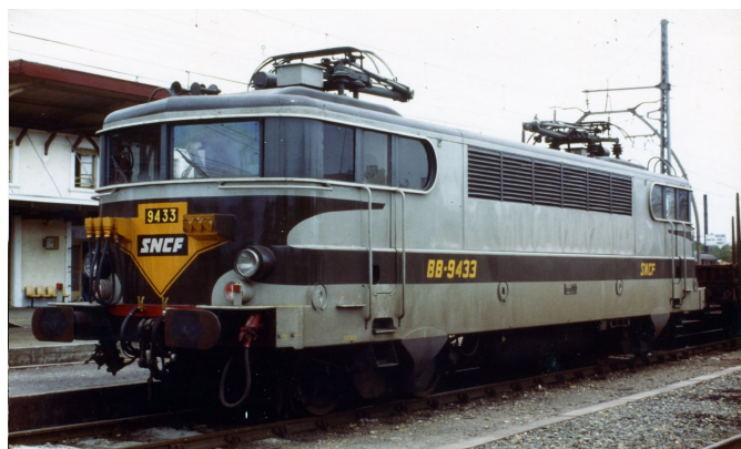
V5.1 - Version Arzens toit bas avec cablots d'UM